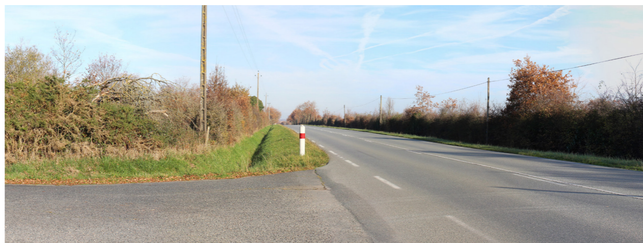
Photographie de l'état initial à 50°